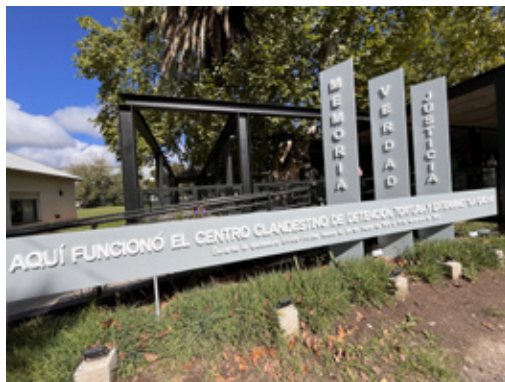
Ingreso al recorrido por el ex Centro Clandestino de Detención La Cacha.

Luego, el grupo pudo recorrer el predio libremente, antes de reunirse nuevamente para una actividad colectiva. La propuesta fue sencilla y profunda: elegir una palabra que representara lo