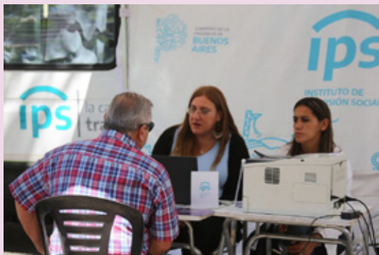
Equipos del IPS brindan atención y asesoramiento durante Fiesta Nacional de la Torta frita en Mercedes.

Estas acciones refuerzan una idea central: el IPS no es solo una oficina, es un organismo que forma parte del territorio y de la vida de su gente.