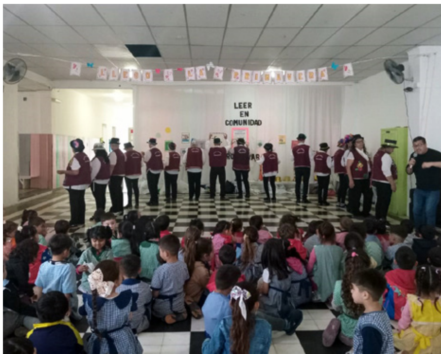
El elenco de Papelonos Brandsen durante una presentación en una institución educativa.

A 13 años de su creación, Papelonos Brandsen sigue creciendo como un espacio donde la creatividad, el afecto y la participación se vuelven protagonistas. En cada ensayo, en cada canción y en cada presentación, se construye algo más que una obra: se construye comunidad. En tiempos donde muchas veces se asocia la vejez con el aislamiento, experiencias como esta muestran otro camino posible, donde animarse, compartir y expresarse son parte de una misma escena.