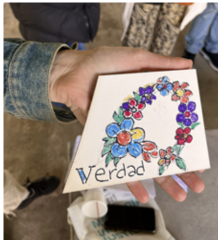
Mosaico intervenido por las y los asistentes al taller.

vivido durante esa jornada. Tras intercambiar ideas, la palabra elegida fue “Verdad”, que quedó plasmada en un mosaico que formará parte de un mural construido entre todas las personas que visitan el espacio.