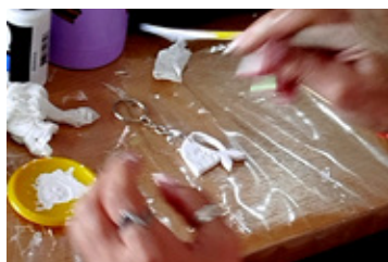
Uno de los pañuelos blancos creados en el taller.