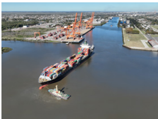
Vista aérea del Puerto La Plata.

El gran punto de inflexión llegó a fines del siglo XIX. En el marco de la fundación de la ciudad de La Plata como nueva capital de la provincia, el Puerto La Plata se proyectó como un puerto moderno, capaz de acompañar el desarrollo económico que se imaginaba para la región. El Puerto La Plata fue inaugurado en 1890 como una obra de ingeniería