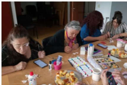
Participantes del taller trabajan en sus piezas de porcelana fría.

Tiene 83 años, es docente jubilada y vive en Caseros.