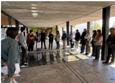
Coordinadoras/es y participantes de la visita guiada.

En tiempos donde se pone en discusión el pasado, sostener estos recorridos colectivos se vuelve fundamental: porque la memoria no es solo un registro de lo que fue, sino una herramienta para construir una sociedad más justa, con verdad, justicia y derechos para todas y todos.