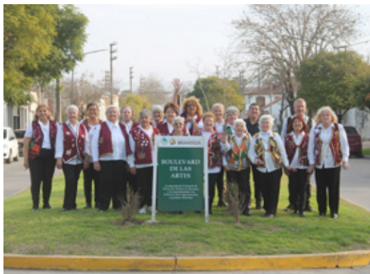
Integrantes de Papelnonos Brandsen posan en el Boulevard de las Artes.

Hace 13 años, en Brandsen, un grupo de personas mayores empezó a reunirse con una propuesta poco convencional: construir instrumentos musicales de papel, cantar, actuar y subirse a un escenario. Lo que parecía un juego se convirtió en una experiencia transformadora. Así nació Papelnonos Brandsen, una de las más de sesenta agrupaciones que integran esta red internacional creada