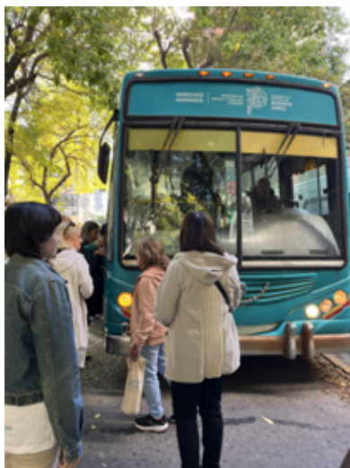
Colectivo de traslado de personas del Programa Recorriendo Memoria.