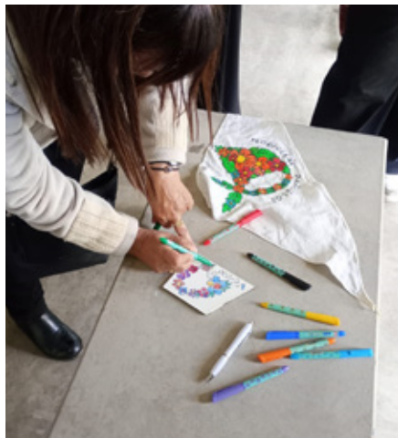
Participante interviniendo el mosaico.